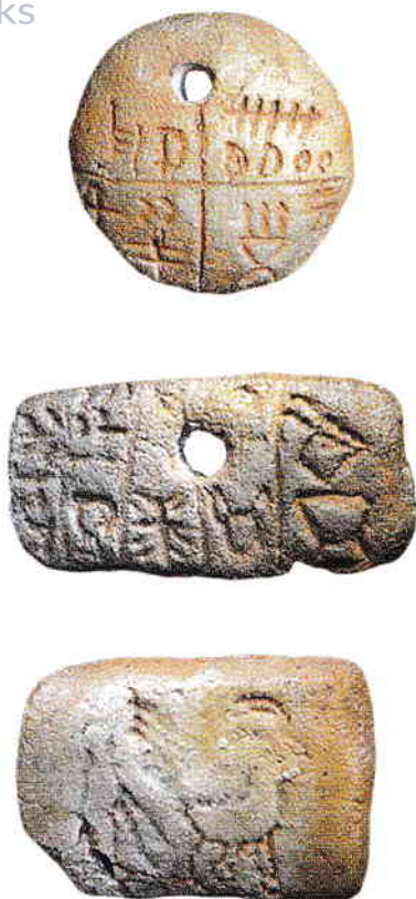
Tăblițele de lut ars de la Tărtăria

Conservarea de către unele comunități Starevo-Criș a ceramicii pictate, la care se adaugă elemente vinciene, a creat în zona arcului estic al Carpaților Occidentali grupul cultural Iclod. Acest complex constituie substratul pe care va lua naștere cultura Petrești. Cercetările de lungă durată de la Iclod au demonstrat că această stațiune dispunea de un sistem complex de fortificații, construit în vremea fazei Iclod I, utilizat și în faza Iclod II, când este abandonat odată cu extinderea locuirii. Tot aici au fost cercetate și