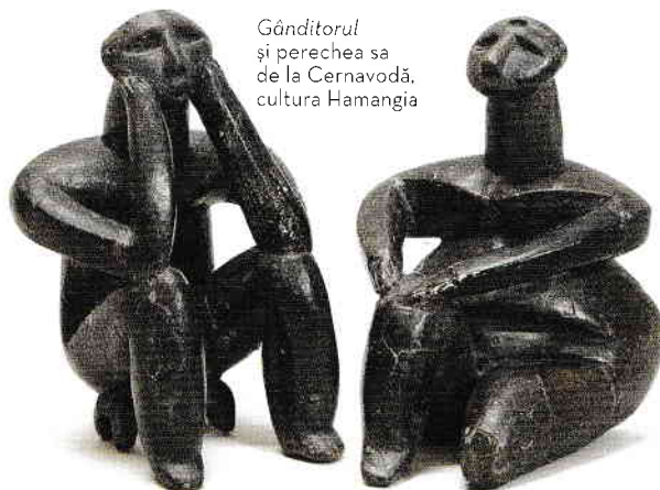
Gânditorul și perechea sa de la Cernavodă, cultura Hamangia

șiruri de împunsături fine ce desenează motive unghiulare și meandrice. Plastica antropomorfă a acestei culturi este cu adevărat excepțională. Formele sunt modelate realist, cu totul excepționale fiind cunoscutul Gânditor (autorul descoperirii s-a gândit la lucrarea lui Rodin) și replica lui feminină, ambele descoperite în așezarea de la Cernavodă. Aceste statuete au fost puse, pe bună dreptate, în legătură cu plastica de la Hacilar, din Anatolia.