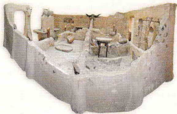
Vedere panoramică a sanctuarului neolitic de la Parța reconstruit în Muzeul Național al Banatului

La sfârșitul etapei Vinča A2 a luat naștere cultura Banat, în cadrul căreia au fost sesizate anumite particularități zonale (grupele Bucovăț și Parța). Așezarea de la Parța (jud. Timiș), intens cercetată, demonstrează că această cultură a atins un grad de civilizație marcat de existența construcțiilor cu etaj și de o viață spirituală complexă, descifrabilă în parte prin componentele marelui sanctuar cercetat aici. Edificiul de cult (cu dimensiunile maxime de 12,6 × 7 m), prezen-